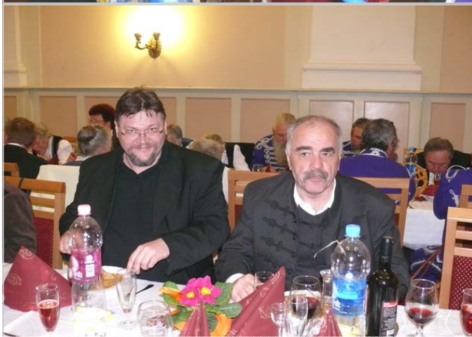
Pillanatképek a bálból