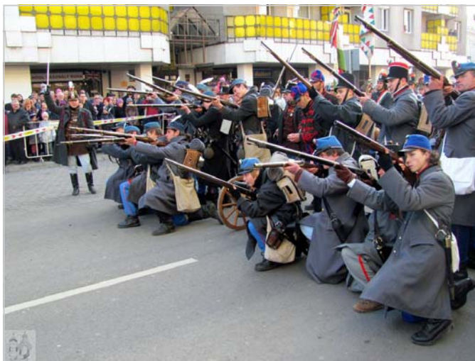
Kiskun huszárok a szolnoki „csatában”